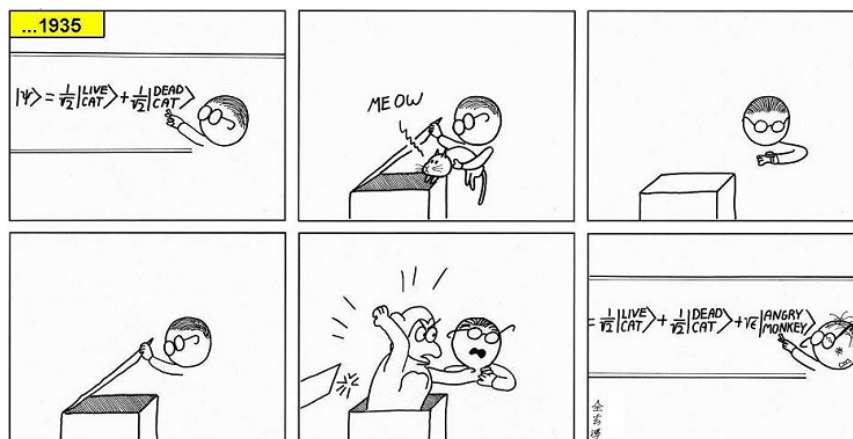
شکل ۱: از [۹]

فیزیک کوانتوم، تاریخچه پیچیده و طولانی ای دارد که گفتنش حداقل به ملموس تر شدن مطلب، کمک زیادی می‌کند. اما به خاطر بی‌سوادی نویسنده در تاریخ کوانتوم، خود کوانتوم و البته برای ایجاز، از گفتن آن می‌پرهیزیم.