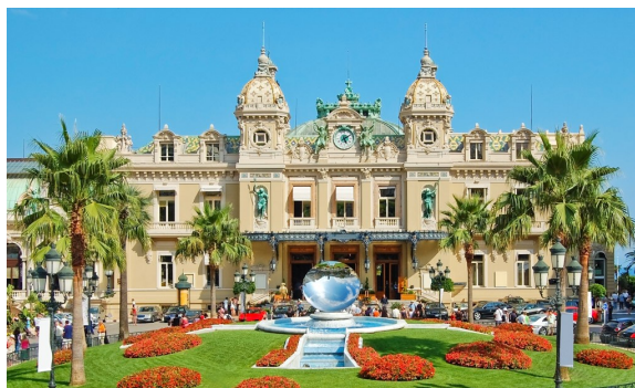
شکل ۳: کازینوی بزرگ مونته کارلو، شاهزاده‌نشین موناکو

یکی از قسمت‌های جذاب و قابل فهم مسئله این است که چه کدی توی کامپیوترهای معمولی مان بزیم که همین مسئله را (در ابعاد کوچک) شبیه‌سازی کند؟ برای یک شبیه‌سازی کاملاً واقعی، پنج کیوبیت را در نظر بگیرید، که حالت آن‌ها تشکیل یک بردار مختلط در فضای 2^5 -بعدی (یا یک تانسور 2 \times 2 \times 2 \times 2 \times 2 ) می‌دهد. فرض کنید حالت اولیه این پنج کیوبیت (00000) باشد، یعنی مقدار آن بردار برابر (1, 0, \dots, 0) خواهد بود. در ساختار تانسوری، اگر بخواهیم یک گیت تک کیوبیتی را (که به ماتریس 2 \times 2 است) روی کیوبیت سوم اعمال کنیم، باید یک ضرب ماتریسی بر روی بعد سوم تانسور حالتمان انجام دهیم. این کد واقعی پایتون همین کار را می‌کند.